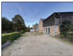
Emplacement de la base vie